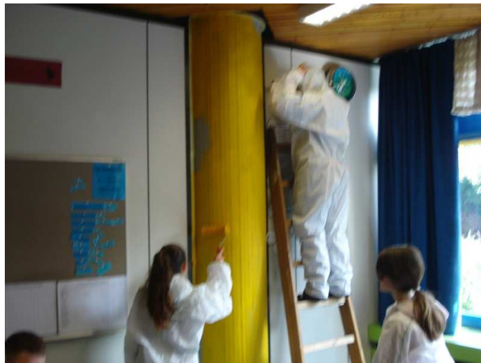
Erst nach dem Abkleben und Grundieren darf mit dem eigentlichen Streichen begonnen werden...