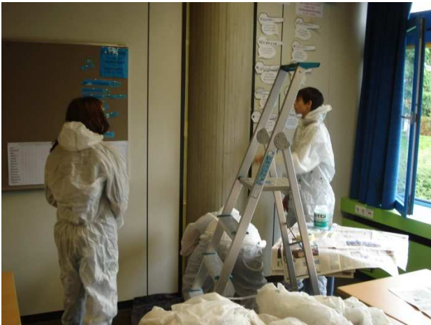
Abkleben der Ränder...ja und Schutzkleidung muss einfach sein...

Projekt der 8.Klasse im Rahmen des BLO-Unterrichts / Farbe- und Raumgestaltung