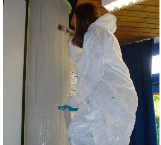
Dann die Grundierung auftragen...